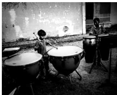
Meridith Kohut: Sarria, Caracas